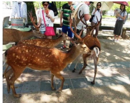
Parque de los Ciervos