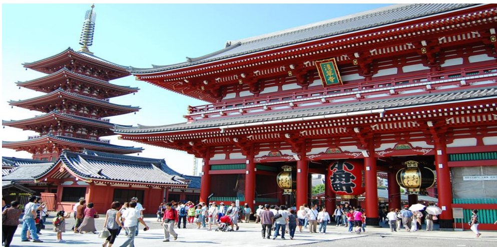
Templo Budista de Asakusa Kannon.

Desayuno. A las 08.15 hrs reunión en el lobby del hotel para salir a la visita de Tokio con guía de habla hispana: Al Santuario Meiji, La Plaza exterior del Palacio Imperial, al Templo Budista de Asakusa Kannon con su arcada comercial de Nakamise. Y al barrio comercial de Ginza. El tour termina en Ginza, y el regreso al hotel será por su cuenta. Alojamiento.