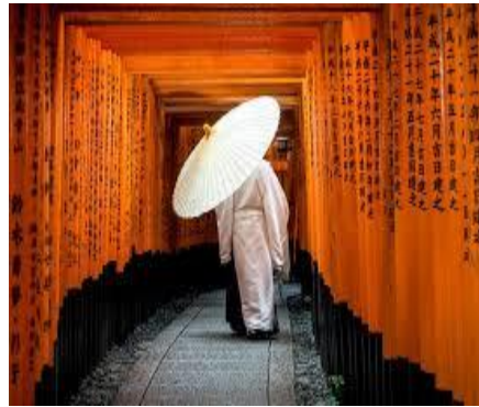
Templo Fushimi- Inari